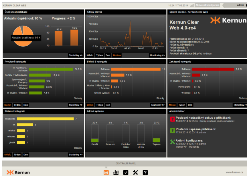
Centrální panel: poskytuje základní přehled o veškerém webovém provozu.